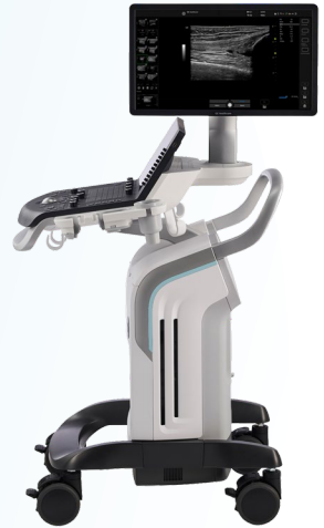
Versana Premier V2